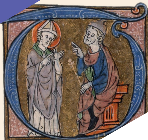
Saint Cyprien de Carthage et le proconsul, missel de l'abbaye de Montier-la-Celle (Champagne), fin XIII e – début XIV e siècle Paris, Bibliothèque nationale de France, nouvelles acquisitions latines 3241, fol. 131 r o