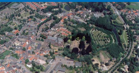
Centrum Sint-Oedenrode rond ca. 2000

Aanmelden: voor 1 december via a.w.de.beer@kpnplanet.nl