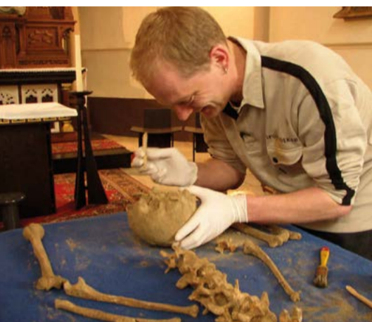
Onderzoek naar de schedel uit het kistje uit het graf van Hildewaris